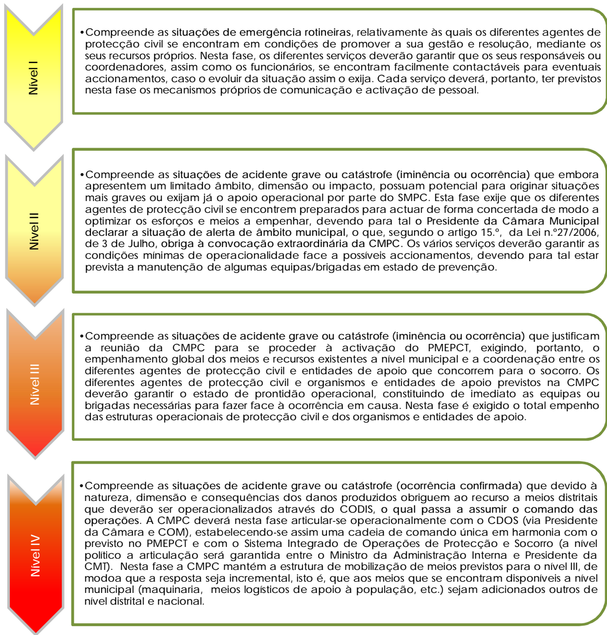
Figura 2. Níveis de intervenção na fase de emergência